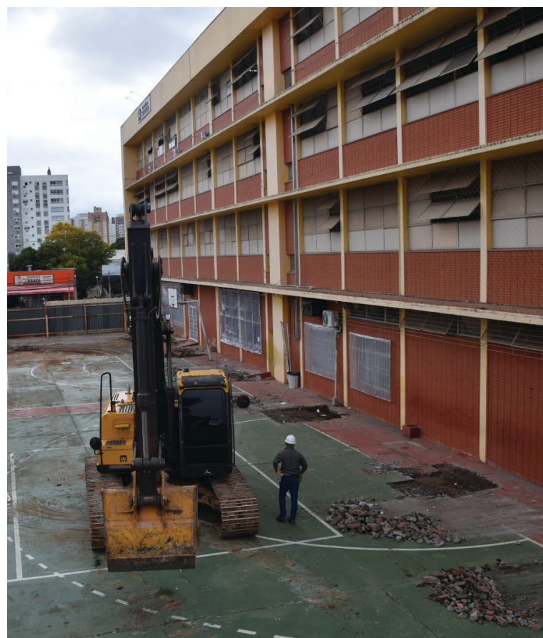
Máquinas já estão operando na Escola

Como parte do processo de melhora e inovação, a escola recebeu uma emenda parlamentar da deputada federal Denise Pessoa. O recurso integra a proposta nº 001231/2026, apresentada ao Ministério da Ciência, Tecnologia e Inovação (MCTI), e tem como objetivo estruturar o eixo de Tecnologias Assistivas do Programa Mesquitec, qualificando a infraestrutura e o ambiente tecnológico da escola.