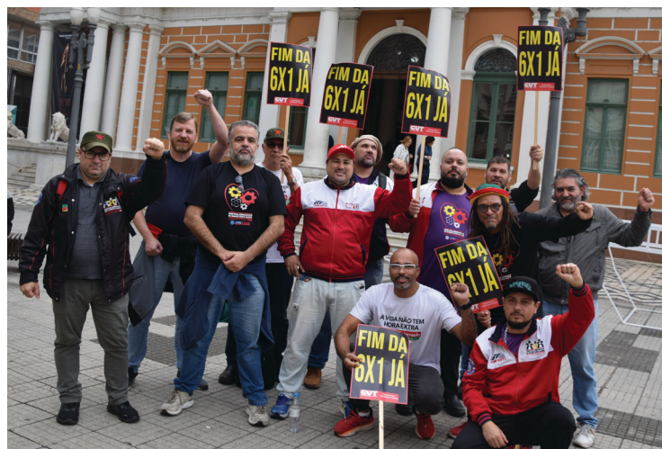
Diretores presentes na vigília em defesa da Redução da Jornada

A redução da jornada de trabalho representa uma das mais importantes reivindicações históricas da classe trabalhadora e pode se tornar uma das maiores conquistas sociais das últimas décadas. Por isso, seguiremos atentos, mobilizados e organizados para garantir a aprovação do fim da escala 6x1 e da redução da jornada sem redução salarial. A luta continua, e os trabalhadores saberão reconhecer aqueles que estiverem ao seu lado na defesa de mais qualidade de vida, mais tempo para a família e mais dignidade para quem produz as riquezas do país.